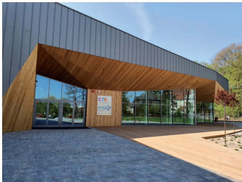
Centrum Tradycji i Kultury w Komornikach

Rosnąca dynamicznie liczba mieszkańców i firm, a także większość obszaru objęta planami zagospodarowania przestrzennego zarówno aktywizacji gospodarczej, jak i budownictwa mieszkaniowego, stale generuje nowe inwestycje. Budujemy drogi, szkoły, budynki użyteczności publicznej, boiska, miejsca do rekreacji. Dzięki gospodarności i zrównoważonemu rozwojowi udaje się to całkiem dobrze. Jednak nie byłoby to możliwe bez naszych mieszkańców. Wsłuchujemy się w ich głosy, rozmawiamy, konsultuje-