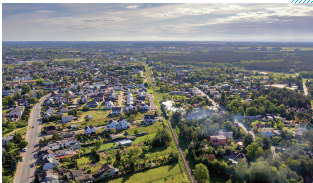
Miejscowość Wiry z lotu ptaka

Zgodnie z hasłem promocyjnym „Komorniki zawsze w dobrym kierunku” – gmina rozwija się w wielu dziedzinach, o czym świadczą nie tylko liczby, ale też zadowolenie mieszkańców. ■