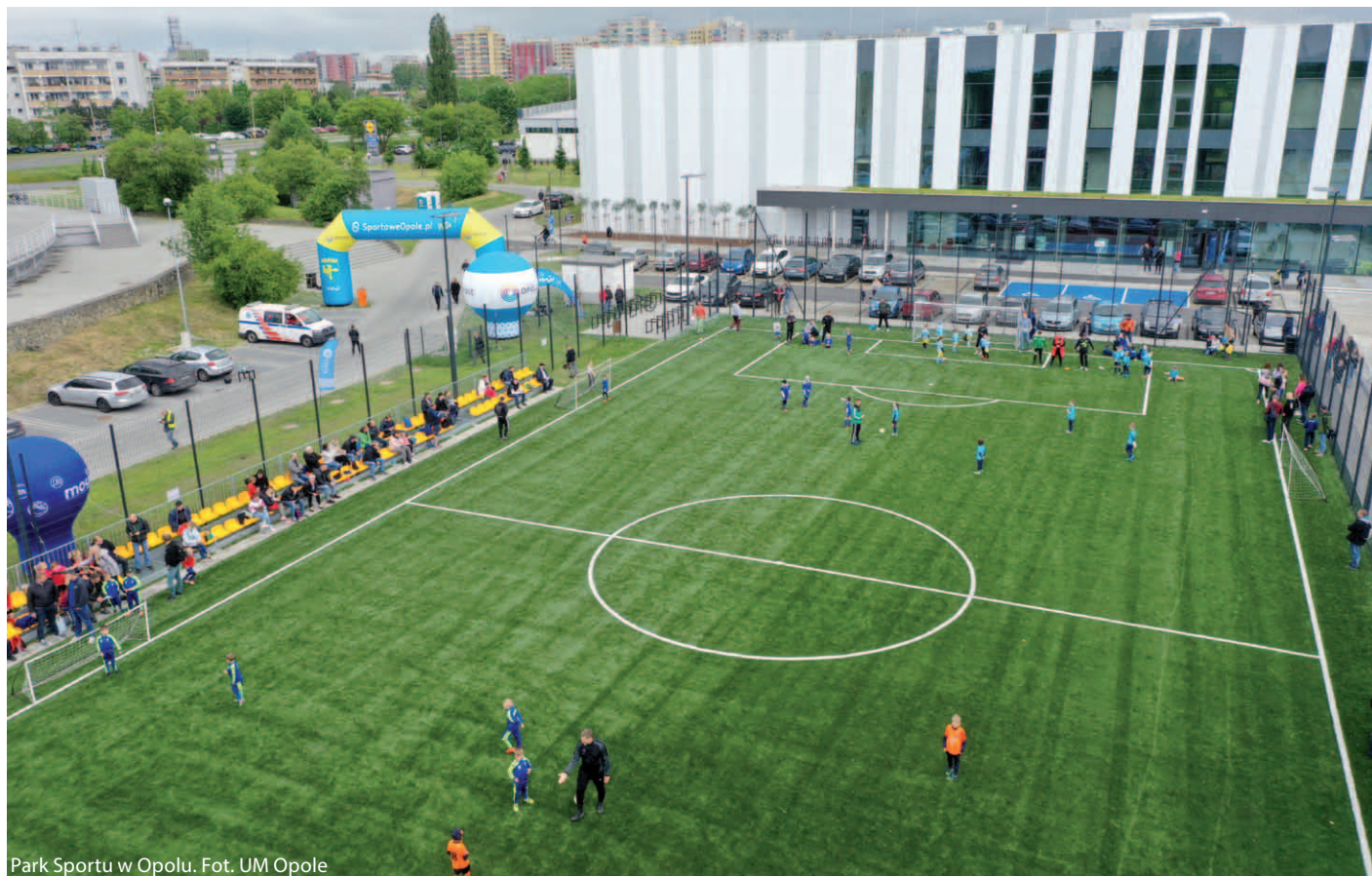
Park Sportowy w Opolu.

Negatywne trendy demograficzne dotyczą niestety większości miast w całej Polsce. Wiemy, że statystyki nie pokazują prawdziwego obrazu, ponieważ w Katowicach są tysiące osób, które tu mieszkają, ale się nie meldują i nie odprowadzają podatków, np. studenci i mieszkańcy nowych osiedli. Naszą odpowiedzialnością jest podnoszenie jakości życia, którą rozumiemy bardzo szeroko. Moje dwa programy wyborcze z 2014 i 2018 roku koncentrowały się właśnie na takich zadaniach i były wynikiem rozmów z mieszkańcami. Naszą strategię utrzymywania i przyciągania nowych mieszkańców opieramy na 3 filarach. Po pierwsze – to miejsca pracy. Po drugie, mieszkalnictwo. Po trzecie, zapewnienie wysokiej jakości życia. Na tempo tych zmian oczywiście wpływa pandemia, ale liczymy, że działania w dłuższej perspektywie zaczną przynosić efekty.