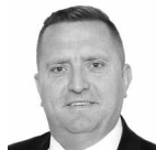
Roland Marciniak burmistrz Świeradowa-Zdroju

Na wyludnianie się Świeradowa-Zdroju wpływ ma też duży popyt na nieruchomości, ich wysokie ceny rynkowe sprawiły, że wielu mieszkańców podjęło decyzję o zrobieniu „interesu życia”. Wykorzystując zainteresowanie inwestorów zdecydowało się na sprzedaż działek, zmianę miejsca zamieszkania, najczęściej osiedlając się w sąsiednich gminach. ■