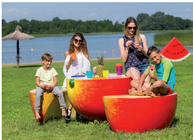
Owocowa Plaża w Zborowie. Znakiem rozpoznawczym są duże rzeźby użytkowe w kształcie owoców.

Uzupełniam też stopniowo kadrę urzędu o kolejnych fachowców, którzy mają tworzyć dobrą atmosferę współpracy z mieszkańcami. Temu między innymi służyć będą konsultacje społeczne w odnowionej formule.