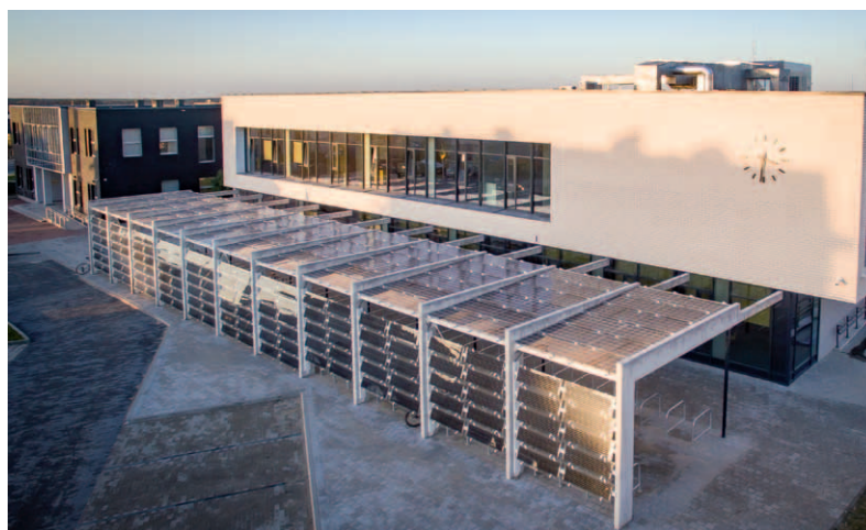
Szkoła podstawowa w Rokietnicy.