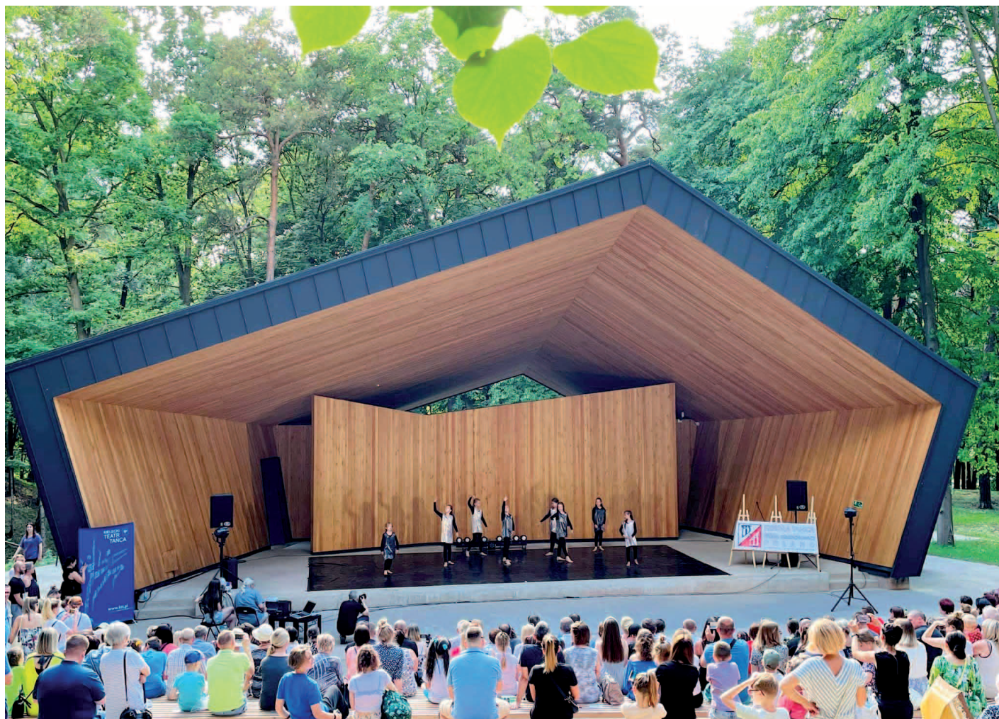
▲ Park miejski w Skarżysku Kamiennej.

W podobnych zjawiskach – migracje na tereny wiejskie, wyjazdy na studia, niska dzietność – powodów depopulacji upatrują również inne miasta powiatowe. Żadne jednak, z którymi rozmawialiśmy, nie czeka biernie. ■