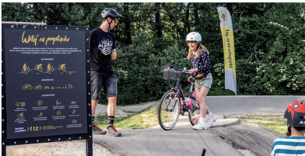
Jeden z pumtracków na terenie gminy Dopiewo. Obiekt powstał w ramach Dopiewskiego Budżetu Obywatelskiego.

Najpierw największy dziennik w regionie „Głos Wielkopolski” poinformował, że Dąbrówka jest jedną z gminnych miejscowości, która zajęła trzecie miejsce w Polsce z największym przyrostem mieszkańców. Potem Serwis Samorządowy PAP opublikował wyniki rankingu „Gmina dobra do życia”, w którym Dopiewo znalazło się na 27. miejscu wśród 2477 gmin. Dobre wieści przypieczętowała informacja Pisma Samorządu Terytorialnego „Wspólnota”, z której wynika, że zajęliśmy 2. miejsce w kategorii gmin wiejskich wśród samorządów z największym przyrostem demograficznym.