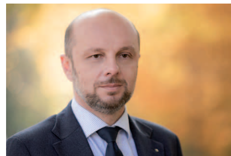
Prezydent Rzeszowa Konrad Fijołek

Od kilku lat w Rzeszowie przybywa żłobków, przedszkoli i szkół. Ten trend na pewno się utrzyma. W tym roku wybudowane zostały lub są na ukończeniu: szkoła podstawowa na osiedlu Bzianka, zespół oświatowy składający