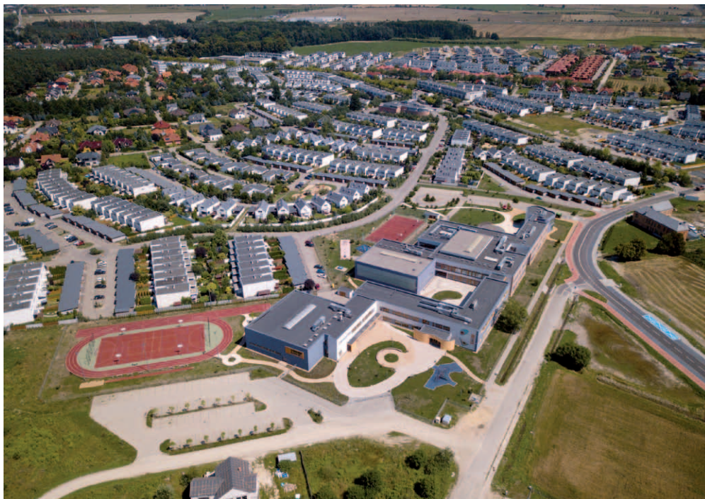
Gmina Dopiewo rozrasta się w mgnieniu oka. Widok na osiedla Dąbrówki. Na pierwszym planie dwukrotnie powiększona szkoła, do której uczęszcza tysiąc uczniów.

Mieszkańcy i samorząd prawie 30-tysięcznej gminy Dopiewo w powiecie poznańskim mają powody do satysfakcji. Trzy niezależne rankingi pokazują, że to miejsce wyjątkowe do zamieszkania.