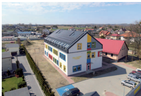
Nowa szkoła w Tuchomiu