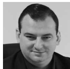
Konrad Krönig prezydent Skarżyska-Kamiennej