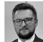
Marcin Krupa prezydent Katowic

Działania przyniosły wymierne korzyści. Od 2015 r. Opole może pochwalić się wieloma sukcesami. W ostatnich pięciu latach było jednym z kilku miast wojewódzkich, w których w każdym roku notowano zarówno dodatnie saldo migracji wewnętrznych, jak i zagranicznych. Od 2016 do 2020 r. Opole było w grupie nielicznych miast z dodatnim przyrostem naturalnym. Kolejnym ważnym i optymistycznym wskaźnikiem jest współczynnik dzietności. Opole w zestawieniu 16 miast wojewódzkich zajmuje 2. miejsce, zaraz po Gdańsku. Wskaźnik dzietności par w stolicy regionu wynosi 1,59. Dla porównania, Gdańsk może pochwalić się wskaźnikiem na poziomie 1,64. Z danych GUS wynika, że Opole ma z kolei najwyższy ze wszystkich stolic regionów współczynnik dynamiki wzrostu dzietności – na poziomie 0,62. Dla porównania, drugi w zestawieniu jest Gdańsk ze współczynnikiem 0,47, a trzeci Kraków – 0,44. ■