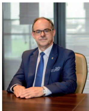
Prezydent Suwałk Czesław Renkiewicz

się zdarza w miastach podobnych do Suwałk. Suwałki samorząd stara się stwarzać idealne warunki do życia i pracy dla ludzi młodych, ale również i osób starszych czy emerytów. Na bieżąco są opracowywane miejscowe plany zagospodarowania przestrzennego, które określają możliwości zabudowy jedno- i wielorodzinnej. Dzięki temu w Suwałkach od kilku już lat utrzymuje się olbrzymi boom mieszkaniowy.